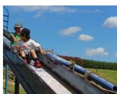
鶴崎スポーツパークにて 個性的な 投げ方

六月六日(土)、前日の雨が うそのように晴れ上がり、予 定通り子どもレクリエーショ ンが行われた。小学生十名が 参加して、ボウリング大会、 昼食会、鶴崎スポーツパーク 帰館後に芋の苗植えと盛りだ くさんの内容で実施された。