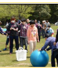
大玉転がしの様子

四月十八日(土) に、うえの園と清 明あけぼの学園による 合同の歓迎遠足が行 われた。利用児者、 職員、総勢 五十二名で 七瀬川自然 公園へ行き、 紅白のチー ムに分かれ、 ディスクゴ ルフと大玉 転がしを行 った。ゴールを指 し、ディスクを力 一杯投げる。大き く反れたりゴール を決めたりする 度に「うわ