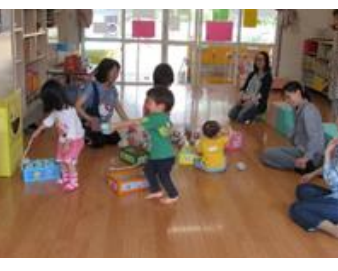
しいのみ広場での 活動の様子