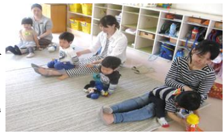
親子で触れ合い遊び