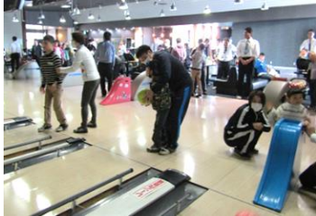
目指せストライク!