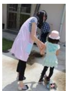
ショートステイ 受け入れの様子