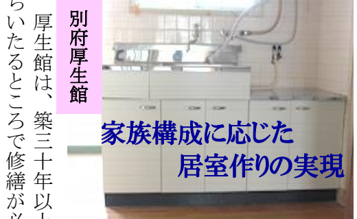
家族構成に応じた 居室作りの実現