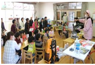
非常食作り 年中・年長クラス